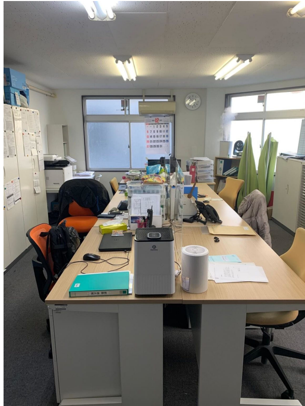
※オハナ・ケアサービス東陽町__事務所